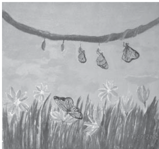
ภาพ : นักเขียนพม่า รร.สอนภาษาไทยแรงงานพม่า กรมฯ

การเดินทางจากพม่าเข้าสู่ไทยของแรงงานข้ามชาติส่วนใหญ่จำเป็นต้องผ่านกลไกของนายหน้า ที่นำพาเข้ามาจากต้นทางถึงปลายทาง จากรายงานผลการศึกษา “นายหน้ากับกระบวนการย้ายถิ่นแรงงานข้ามชาติสัญชาติพม่า กรณีศึกษาแรงงานข้ามชาติและครอบครัวในพื้นที่จังหวัดสมุทรสาคร” ซึ่งจัดทำโดยเครือข่ายส่งเสริมคุณภาพชีวิตแรงงาน Labour Rights Promotion Network (LPN) ได้ชี้ให้เห็นถึงวิธีการเข้ามาของแรงงานโดยมีนายหน้าเป็นผู้ดำเนินการให้โดยคิดค่าจัดการต่อคนประมาณ ๘,๐๐๐ - ๑๕,๐๐๐ บาท งานวิจัยชิ้นนี้ระบุว่า แรงงานต้องมีค่าเดินทางตั้งแต่ต้นทางตั้งนั้นบางคนจึงต้องขายที่นาหรือวัวควายเป็นค่าเดินทาง ซึ่งหากแรงงานมีค่าเดินทางให้ตั้งแต่ต้นทางก็จะได้รับการดูแลอย่างดี แต่ก็มีที่แรงงานบอกว่าพ่อแม่หรือญาติซึ่งอยู่ที่มหาชัย จ.สมุทรสาคร จะมารับ เมื่อถึงแล้วญาติจะจ่ายเงินให้ อีกกรณีหนึ่งหากแรงงานต้องการมาทำงานแต่ไม่มีเงิน นายหน้าจะเสนอทางเลือกให้ว่า จะออกให้ก่อนและหางานให้ ซึ่งแรงงานกลุ่มนี้จะมีโอกาสเข้าสู่กระบวนการค้ามนุษย์ ถูกแสวงหาประโยชน์ ล่วงละเมิดทางเพศ ส่งไปขายต่อในโรงงานที่บังคับใช้แรงงาน หากเป็นผู้ชายก็ถูกส่งลงเรือประมง ซึ่งทั้งสองกรณีถือว่าเป็นการเข้ามาโดยสมัครใจ แต่ยังมีกรณีที่สาม คือแรงงานถูกนายหน้าซึ่งเป็นคนชาติเดียวกันไปชักจูงล่อลวงให้แรงงานมาทำงาน โดยอ้างว่ามีงานดีๆ ให้ทำ และจะออกค่าเดินทางให้ทั้งหมด ซึ่งแรงงานที่ถูกหลอกมาจะถูกส่งไปค้าประเวณีตามร้านอาหาร ร้านคาราโอเกะ นวดแผนโบราณ หรือถูกขายลงเรือประมง หรือบังคับให้ทำงานในไร่เกษตร