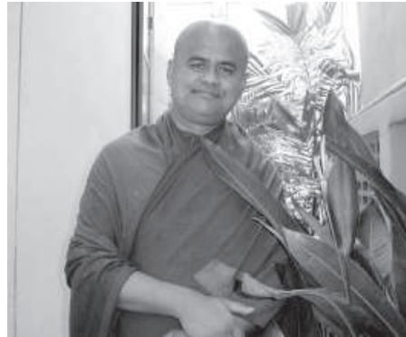
ท่านจันทร์ ๑

พลเอกเปรม เป็นบุคคลตัวอย่างที่น่าจะนำมาเป็นกรณีศึกษาของคนไทยในทุกยุค แม้ว่าท่านจะเป็นผู้อาวุโสมากแล้ว บางคนอาจจะเถียงว่าท่านเป็นบุคคลที่เก่ามาก จนอาจจะไม่เหมาะกับยุคปัจจุบัน แต่อาตมาว่าความดีงาม มันเป็น “อกาลิโก” คำว่า อกาลิโก เป็นศัพท์