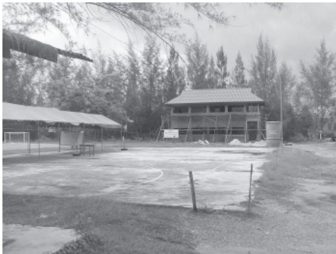
สถานที่ก่อสร้าง กลุ่มมอมทรัพย์เพื่อพัฒนาสังคมบางลา หมู่ที่ ๘ ต.ป่าคลอก อ.ถลาง จ.ภูเก็ต

ด้าน สุรัตน์ บำรุงนา เภรัญญิกกลุ่มอนุรักษ์ป่าชายเลน