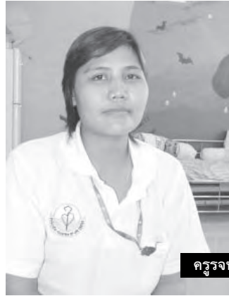
ครูจรรยา

ก็มีได้แตกต่างไปจากเด็กคนอื่นๆ เท่าใดนัก