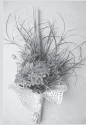
ศุ บุญเลี้ยง