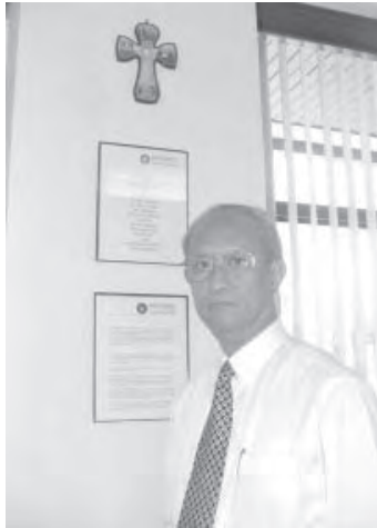
การตามกระแส ไม่ใช่สิ่งที่ผิด แต่เราต้องไม่ลืมจิตตารมณ์ของเราเอง

“ทางวาติกันบอกว่า สถาบันการศึกษาคาทอลิกต้องไม่ลืมงานประกาศ แต่ถ้าเราคิดว่าตรงนี้ มันมีเงื่อนไขไม่ควรทำ เพราะอย่างนั้นอย่างนี้ ทางวาติกันบอกวาก็ไม่จำเป็นต้องมีโรงเรียนคาทอลิก คนอื่นเขาก็ทำกันได้ ไอ้ที่เราทำได้ดีจ้ คนอื่นเขาก็ทำได้ แต่คนอื่นทำงานประกาศไม่ได้ เป็นเราเท่านั้นที่จะทำ ทำอย่างไรให้เหมาะสมเป็นอีกเรื่อง