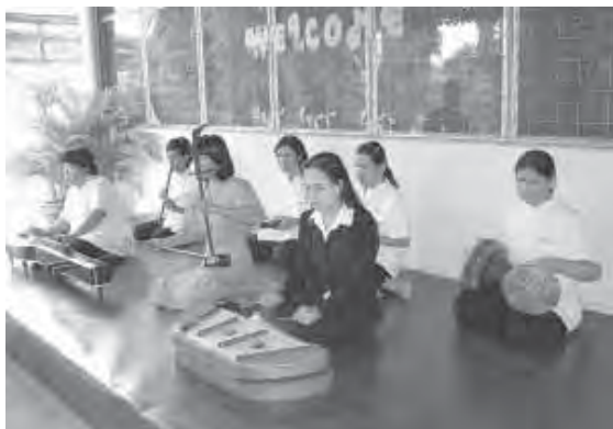
เล่นดนตรีไทย ดอกรับแขกต่างๆ ที่มาเยือน ศูนย์ฝึกอาชีพหญิงพิการทางสายตา

“แต่ละเดือนใช้เงินไม่หมดหรอก ถ้าไม่มีเหตุจำเป็นอะไรฉุกเฉิน ปกติใช้เงินจริงๆ ไม่เกิน ๒,๐๐๐ บาท แค่นั้นไปเดินห้างไม่บ่อยอยู่แล้ว เพราะไม่ชอบ ไปเดินห้างแล้วเสียสตังค์ ไม่ไป นอกจากต้องการสิ่งของบางอย่าง และจะไม่เดินเที่ยวด้วยนะ คือ สมมุติเราต้องการสบู่ ยาสีฟัน