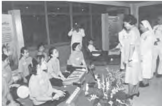
ร่วมแสดงรายการต้อนรับสมเด็จพระเทพ โอกาสเปิดห้องสมุดใหม่

เราก็จะไปที่แผนกนั้นเลย ไม่งั้นเราไปเดินเที่ยว เราเจออะไรอะ ไอนั้นก็ถูก ไอนี้ก็อยากได้ โดยที่เราไม่ได้ตั้งใจหรอกว่าจะเอา นี่คือสิ่งฟุ่มเฟือย เราไม่ตั้งใจ แต่เรากลับต้องมาเสียสตังค์ บางที อ้าว ไม่ได้ตั้งใจเลยนะแต่กลับเสียเงินเป็นพัน และเราก็เสียตายตังค์นะ โอ้โหทำงานแทบตาย เงินเดือนแต่ละเดือนกว่าจะได้ ทำไมจะต้องไปเสียกับอะไรแบบนั้น นอกจากบางทีก็ให้รางวัลชีวิตกับตัวเองบ้าง ปีหนึ่งจะไปดูหนังในโรงหนังสักหนหนึ่ง ก็คือ ถ้าเราใช้อย่างประหยัดพอเพียง เราก็ไม่ต้องไปเป็นหนี้ใคร”