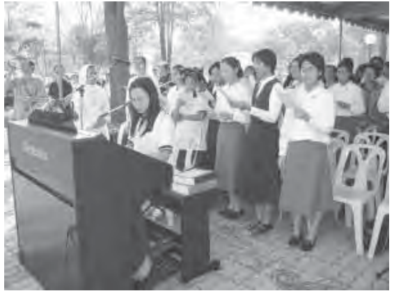
มือออร์แกน วันเสกป่าศักดิ์สิทธิ์ ของวัดพระเยซูเจ้าเสด็จขึ้นสวรรค์ สามพราน

ผลิดอกงามแตกกิ่งใบ จับดวงใจแม้ใครบังเอิญได้เดินมองมา อาจจะพบเห็นเห็นด้วยตา ต้นชบาขึ้นในโรงเรียนสอนคนตาบอด ไม่อาจชมดอกชบา ด้วยดวงตาสองตามีกรรมโลกจึงมีดม ไม่อาจพบเห็นเหมือนบางคน ว่าดอกผลนั้นมีสีสีนรูปทรงอย่างไร **บอดก็เพียงสายตาเท่านั้น แต่จิตใจก็ยังผูกพันความงาม อาจจะรับรู้ไปตาม สุดกลิ่นงามพึงเสียงวิไลร่มไม้บังเงา** ต่างก็เพียงผู้จะชม สิ่งจะชมสำคัญในมันนั่นคืออันใด เหตุกับผลนั้นหรือว่าใจ ต้นชบาก็มีความหมายไปตามคนมอง สิ่งจะงามอยู่กับใจ บอดที่ใจ เห็นไปอย่างไรไม่มีวันงาม โลกจะสวยนั้นสวยไปตาม จิตที่งาม มองโลกสดใสไปในทางดี